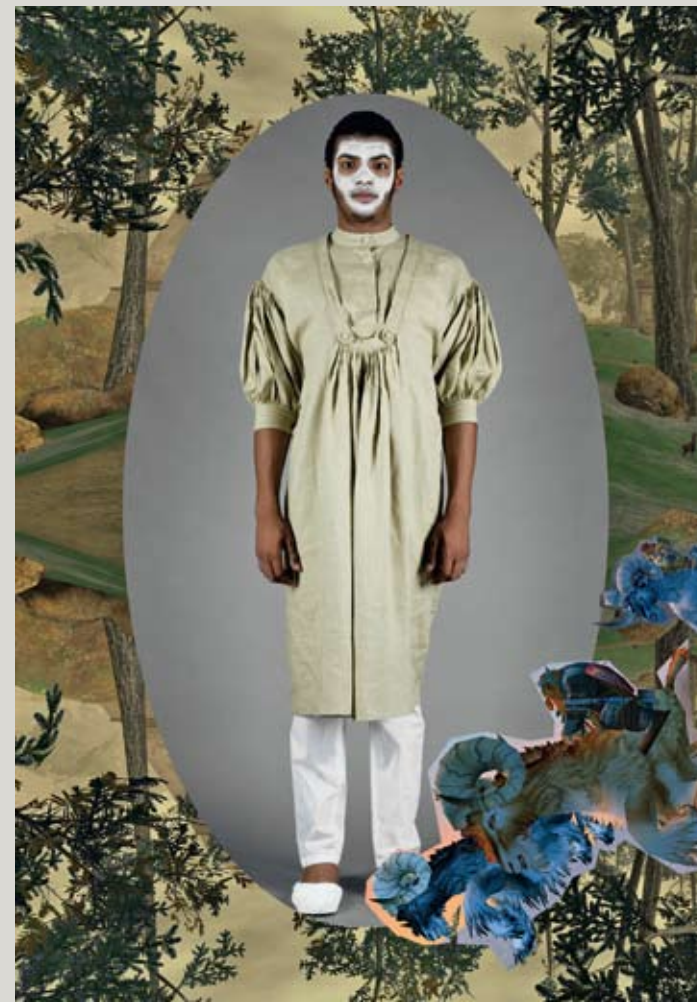
From the 2009 Spring-Summer collection.

»Rozalb de Mura« is sort of the mythic alter ego of the Rumanian fashion designer Olah Gyarfas, and his label's name patron. Rozalb de Mura's world leans towards the fairytale although Gyarfas also creates such mundane objects as the bag for the latest Berlin Biennale. The basis for his garments is the same model of a classic men's suit, which he then adorns with fanciful elements like the »Vitézkötés«, the Hungarian »cord for the brave«, a military decoration still worn on traditional costumes today.