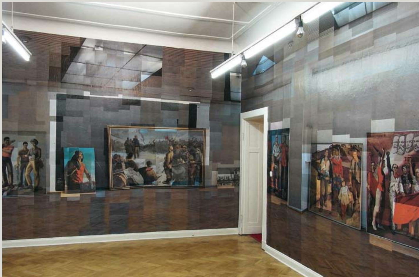
KATHARINA GAENSSLER, photo installation, four walls, approx. 76 qm, 2.106 colour laser prints, 27x40,5 cm each.

In Albania's National Gallery in Tirana, you'll still find socialistic paintings of an era long gone, there's no sign of the lively contemporary art scene to be found anywhere. Katharina Gaenssler has photographed the National Gallery in 2106 individual images, then printed and reinstalled them in form of wallpaper in a Berlin exhibition space. There's an exciting tension about the work: On the one hand, the art displayed in the National Gallery is degraded into something merely decorative through reproduction as wallpaper, on the other hand, by being translated into a contemporary art work the institution achieves the attention of the contemporary art scene.