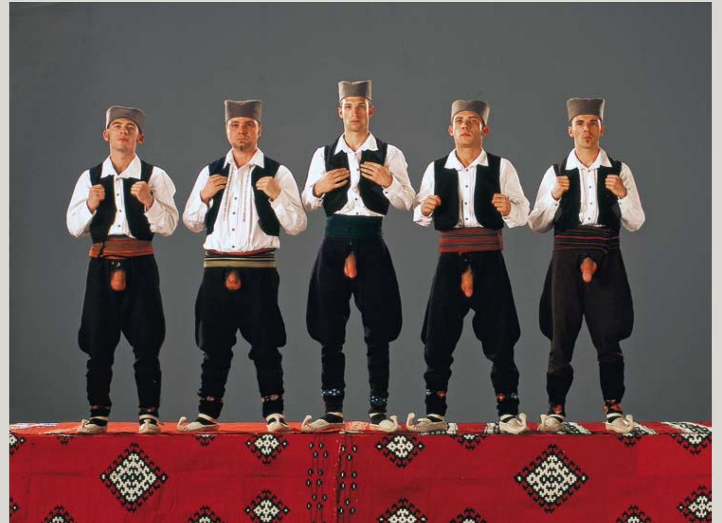
MARINA ABRAMOVIC, video still from Balkan Erotic Epic (Men in National Costume), Belgrade 2005.

Again and again, Yugoslavian artist Marina Abramovic keeps returning to her Balkan roots. In Balkan Erotic Epic she illustrates the way sexuality was dealt with in the archaic traditions in this region. Accordingly, the presentation of sexual potency was not pornographically motivated but served, for example, to calm natural's power. If too much rain threatened to destroy the harvest, the women in the fields lifted their skirts to scare the gods away and end the rain. But to a modern beholder unfamiliar with these traditions, there's nothing natural about this exhibition of sexual organs. The loss of a natural attitude towards the human body is powerfully illustrated by this work.