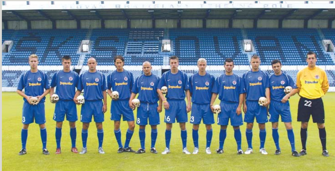
ANETTA MONA CHISA/LUCIA TKÁČOVÁ, SLOVAN , 2006. Photo© the artists, courtesy Galerie COLLECTIVA, Berlin.

In dieser Arbeit von Anetta Mona Chisa und Lucia Tkáčová, mit der sie oft zusammenarbeitet, posiert die Mannschaft des Fußballvereins SK Slovan statt mit Bällen mit Schädeln, die in Ausgrabungsstätten unweit des Fußballstadions in Bratislava gefunden wurden. Slovan ist nicht nur der Name des Clubs, sondern auch die Bezeichnung für Urslaven. Neben diesem Verweis trägt die Arbeit aber noch einen unguuten Beigeschmack, der Gedanke an Massengräber, an denen Slowenien reich ist, drängt sich unweigerlich auf.