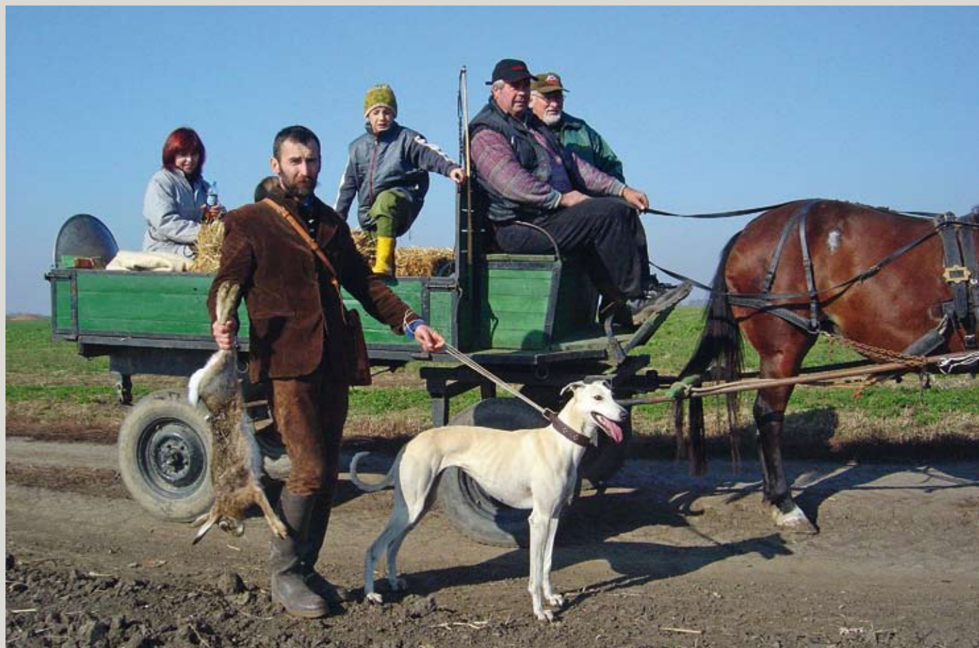
LÁSZLO CSÁKI/SZABOLCS PÁLFI, Agár – The Hungarian Greyhound Project , 2006. Commissioned by Thyssen-Bornemisza Art Contemporary, Vienna.

Der Agár, auch Ungarischer Windhund genannt (obwohl er streng genommen gar kein Windhund ist), ist eine kräftigere, robustere, allerdings auch langsamere Variante des Rennhundes. Er wurde im Zehnten Jahrhundert von den Magyaren ins heutige Ungarn und Rumänien eingeführt und wird immer noch unverändert gezüchtet. Das ungarische Künstlerduo László Csáki und Szabolcs Pálfi hat den Agár zur Hauptfigur einer Videodokumentation gemacht. Die Collage aus Jagd- und Rennszenen und Interviews mit Züchtern, Tierärzten, Jägern und Politikern zeichnet allerdings eher ein Bild der Gesellschaft als ein Portrait des Hundes.