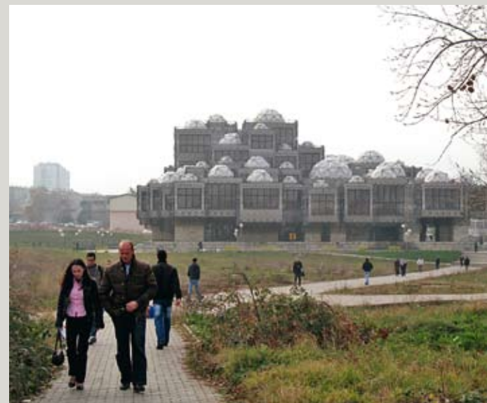
National Library in Prishtina, Kosovo, hosting the Contemporary Arts Library.

The photos of Albanian photographer Silva Agostini portray Tirana in a state between melancholic contemplation of the old and anticipation of the new. The economic upswing led to a construction boom here from 2002, and although the colourfully painted facades of some socialist high-rises speak more of a cosmetic make-over than substantial building activity, the city's art scene shows some promising substance. As can be seen in »my space 03 Tirana-Berlin«, Haus am Lützowplatz, Berlin, until 4 January 2009.