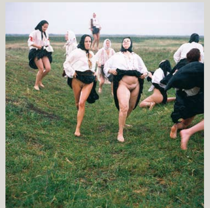
MARINA ABRAMOVIC, video still from Balkan Erotic Epic (Women in the Rain), Belgrade 2005.

Immer wieder kehrt die Jugoslawin Marina Abramovic zum Balkan und damit zu ihren Wurzeln zurück. In Balkan Erotic Epic illustriert sie den Umgang mit Sexualität in den heidnischen Traditionen dieser Region. Die Präsentation sexueller Potenz war demnach keinesfalls pornographisch motiviert, sondern diente zum Beispiel zur Besänftigung von Naturkräften. Drohte zuviel Regen die Ernte zu zerstören, lüfteten die Frauen auf den Feldern ihre Röcke, um die Götter zu verjagen und den Regen zu beenden. Doch für den heutigen Betrachter, der solch naturverbundene Traditionen weder kennt noch lebt, haftet der Zurschaustellung von Geschlechtsmerkmalen keinerlei Natürlichkeit an. Der Verlust des Selbstverständlichen im Umgang mit Körperlichkeit wird uns hier kraftvoll vor Augen geführt.