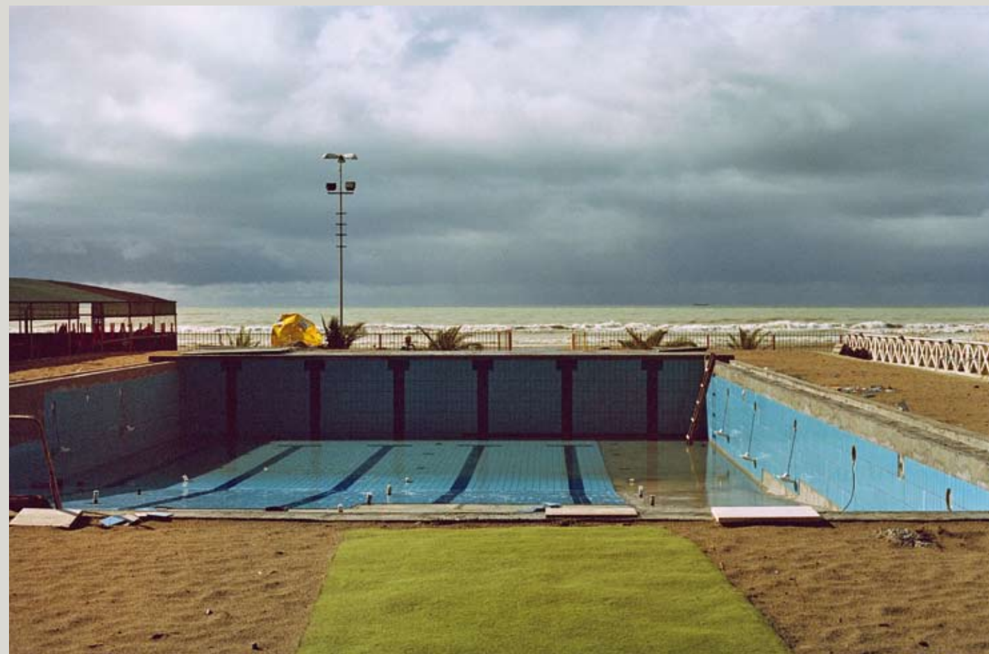
SILVA AGOSTINI, pishina , 2006. C-print on plywood, 93x140 cm.

Die Photos der in Berlin lebenden Albanerin Silva Agostini zeigen Tirana in der Schwebe zwischen Melancholie und Aufbruch. Der wirtschaftliche Aufschwung löste ab 2002 einen Bauboom in Tirana aus, und auch wenn die bunt gestrichenen Fassaden von Plattenbauten eher als oberflächliche kosmetische Behandlungen durchgehen denn als Zeichen substantieller Bautätigkeit, Tiranas Kunstszene zumindest zeigt vielversprechende Substanz. Nachzuprüfen in »my space 03 Tirana-Berlin«, Haus am Lützowplatz, Berlin, bis 4. Januar 2009.